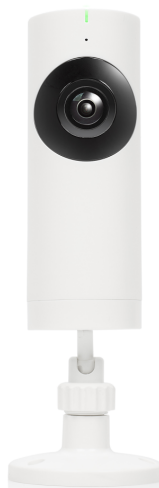
Panoramic IP camera indoor